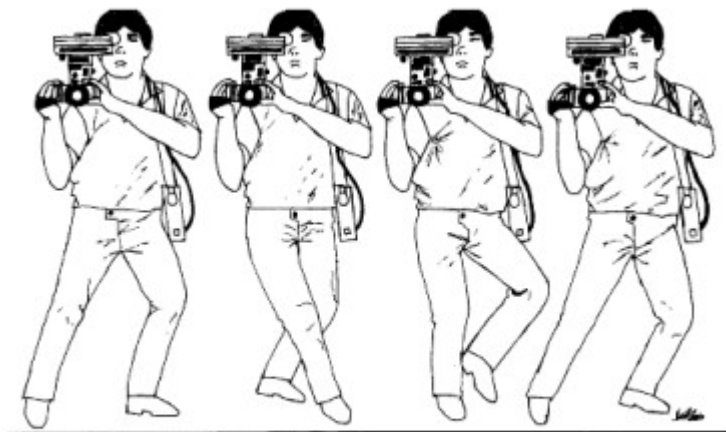
: Hodanje u stranu

Ista pravila važe i kada se snimatelj kreće bočno u stranu,